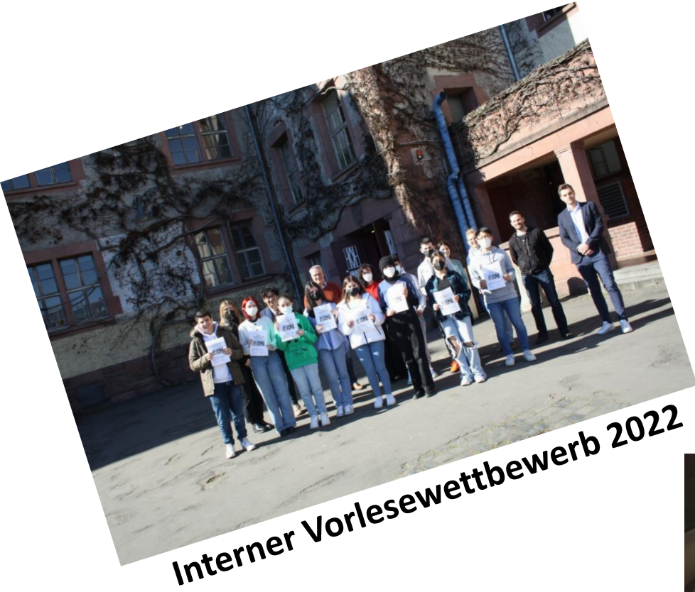
Interner Vorlesewettbewerb 2022