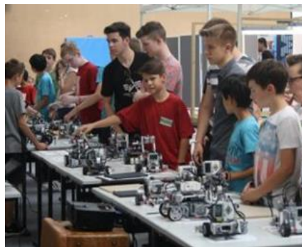
Wettbewerb WRO 2018

Im Rahmen der Junior Ingenieur Akademie (JIA) erlernen unsere Schülerinnen und Schüler technische Fähigkeiten beim Zusammenbau und Programmieren von Robotern und nehmen an der World Robot Olympiad (WRO) teil.