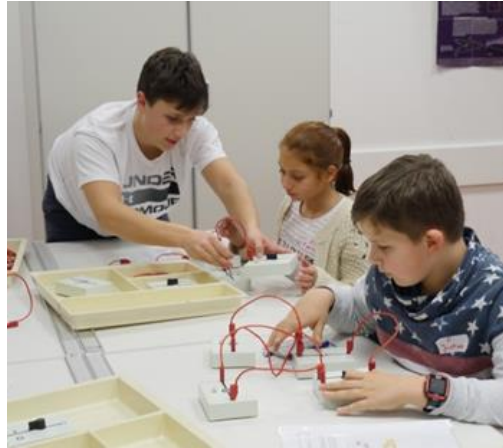
Science-Schnuppernachmittag für Viertklässlerinnen und Viertklässler, 2020

Hierbei werden die Grundschülerinnen und Grundschüler sowohl von Schülerinnen und Schülern der NaWi-Klassen gruppenweise durch alle naturwissenschaftlichen Fachräume begleitet als auch in den einzelnen Fachräumen von Schülerinnen und Schülern der NaWi-Klassen und der Leistungskurse bei den Versuchen unterstützt. Als spezielles Angebot – gegen einen kleinen Obolus – können sich die Grundschülerinnen und Grundschüler ihre eigene DNA in Halsketten verewigen lassen.